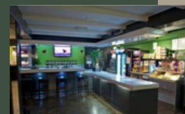
Kleur van de keim

De oude bakstenen aan de onderkant van de gevel worden dus hergebruikt. Om ze toch te laten blenden met de kleuren van het nieuwe gedeelte van het pand, gaan we ze keimen. Benieuwd naar de kleur? We hebben een stukje gevel gekeimd om de kleur te beoordelen. De kleur is te zien vanaf de Oliemolenwal!